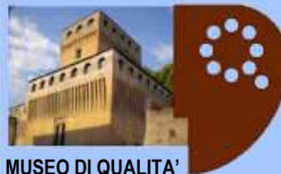
MUSEO DI QUALITA'